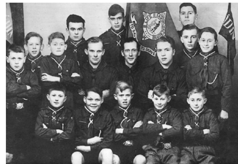
Dreingjaskótar á legu í Kvívík undir 2. heimsbardaga.

– At geva bøkurnar út, var mitt hugskot, tí vit høvdu so nógv tilfar liggjandi. Øll vildu vera við í útgávu, vóru