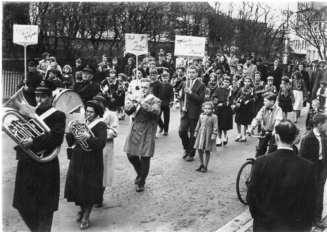
Páskastevna í Havn. Horntónleikurin hjá Frelsunarherinum hevur mangan rungað í Havnar-gøtum.