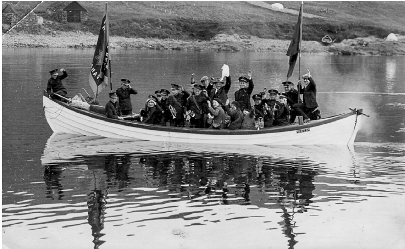
Vitjan í Suðuroy í 1934. Hornorkestrið í báti.