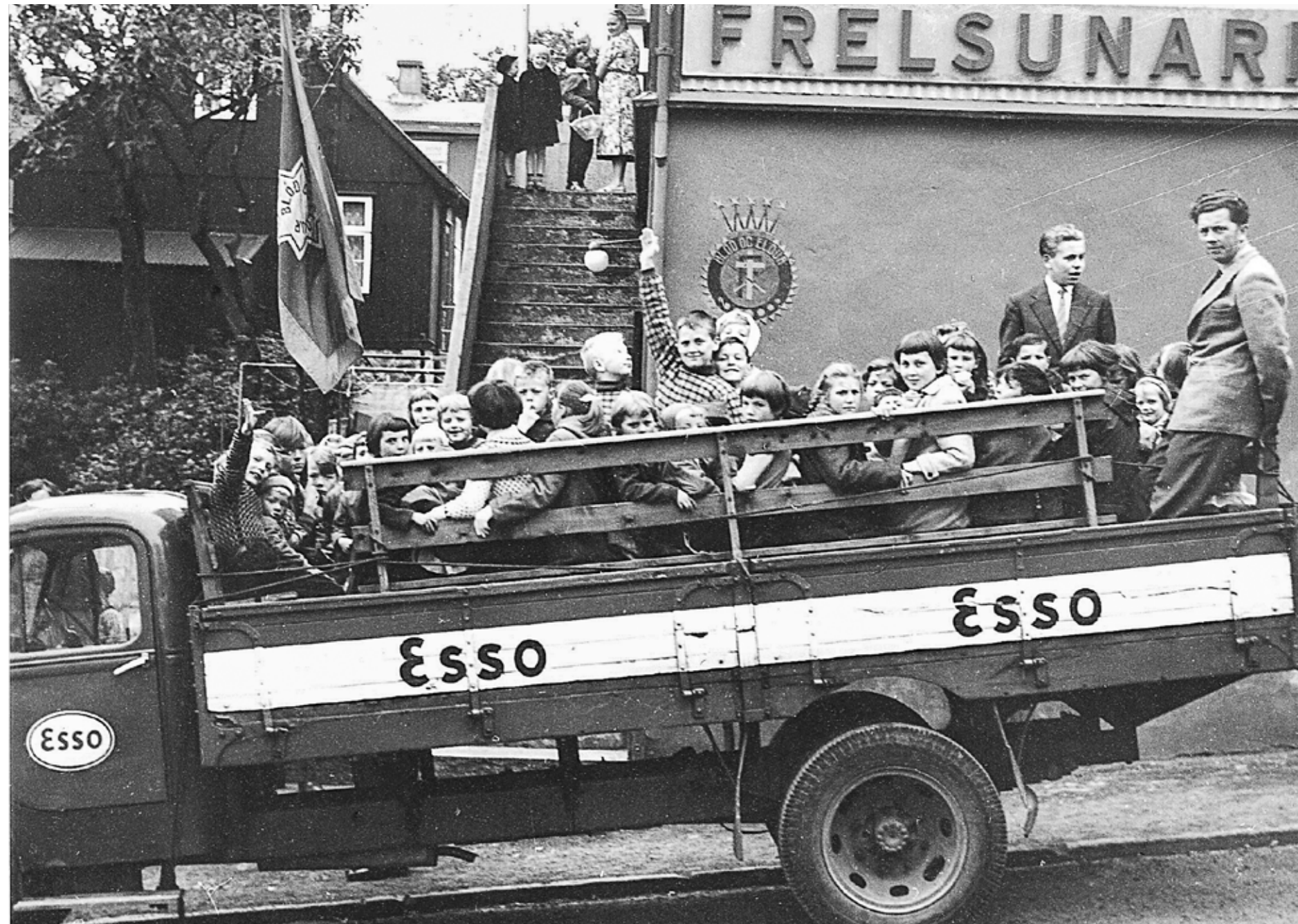
Á veg á sunnudagsskúlaútfærd í 1958/1959.

vóru vælkomín. Horntónleikurin kom tíðliga. Útimótir vóru tvær ferðir um vikuna og vóru kend í býarmyndini tá, siga tær.