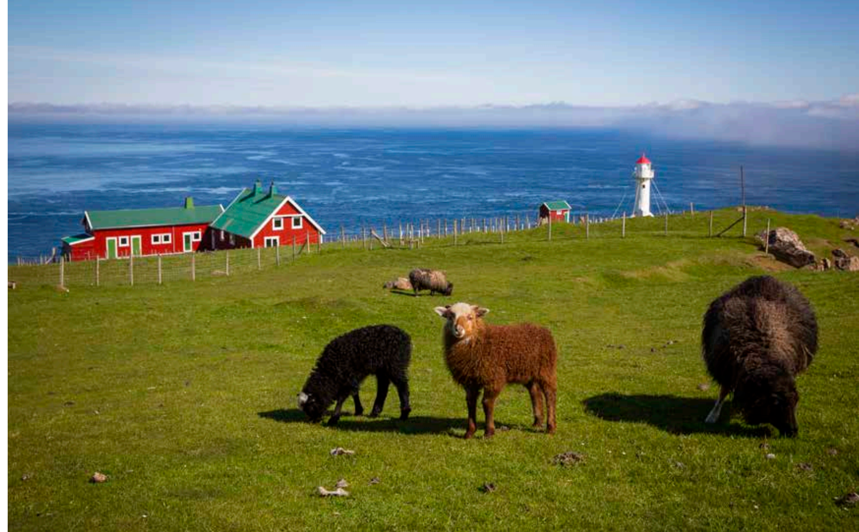
Seyðurin er nógvur. Tað er umleið dupult so nógvur seyður sum fólk (uml. 52.000) í Føroyum. Við meira enn 100.000 seyðum er brúk fyri nógvum grasi.

– Men vit hava roynt tað, sum stendur í Bibliuni; at „tá, ið eg eri veikur, tá eri eg sterkur“. Vit eru ein lítill samkoma og vit eru hundrað prosent bundin av, at Gud er við. Gud arbeiðir gjøgnum menniskju, sum geva honum æruna.