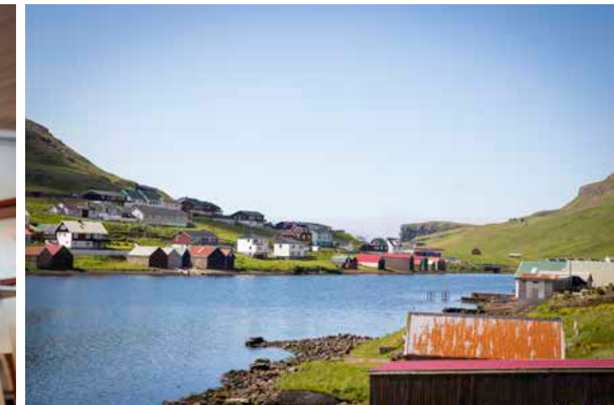
Suðuroyggin er sunnasta oyggj í Føroyum. Hon er 32 kilometrar long við djúpum firðum og brøttum fjøllum. (Myndir: Mette Randem)