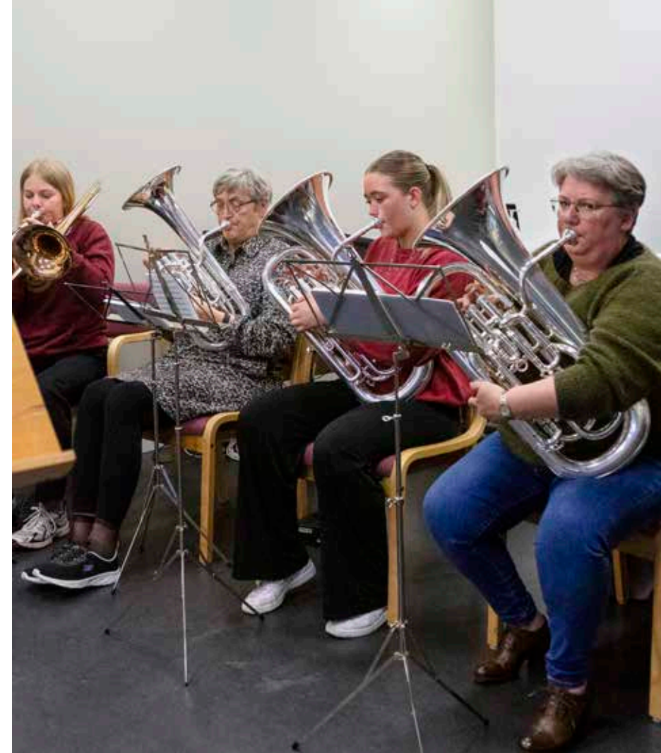
Horntónleikurin hevur stóran týðning fyri felagsskapin. Fólk í øllum aldri hugna sær saman. Hvørt sunnukvöld eru 20 tónleikarar klárir, og mjúkur brasstónleikur fyllir mótisalin í Tórshavn.