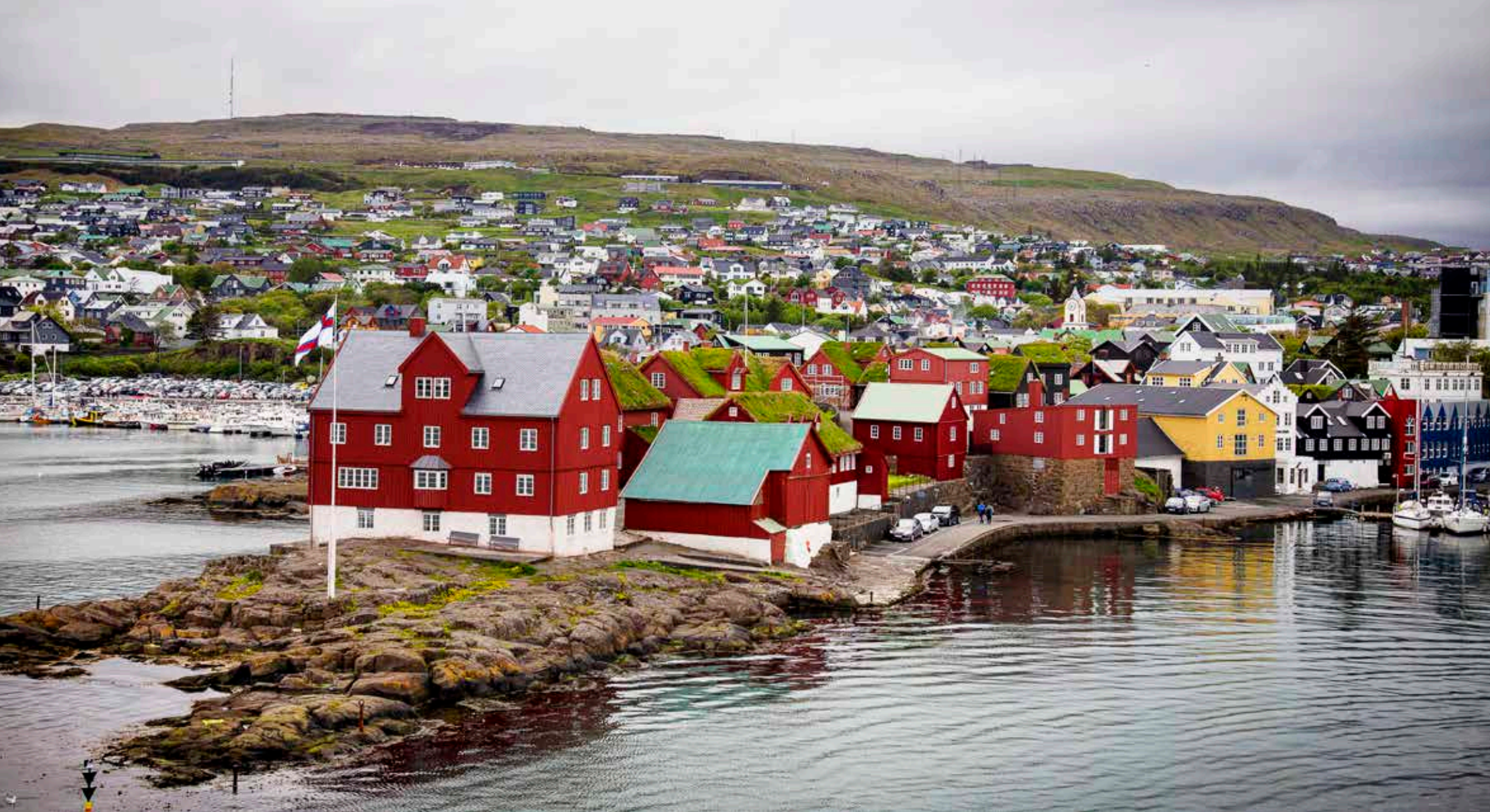
Í Tórshavn, høvuðsstaðnum í Føroyum, búgva fleiri enn 20.000 fólk.