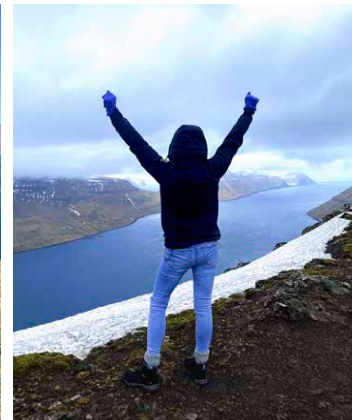
Úti á teim grønu víddunum í Føroyum, fáa tey ungu góða kropsvenjing. Í fimm tímar klatra tey upp og niður á fjøllunum og njóta útsýnið út á hav.

veitsluni. Um 11- tíðina um kvøldið ringdi eg til hana og segði frá, at nú koyrði eg heim. Eg hevði ikki drukkið.