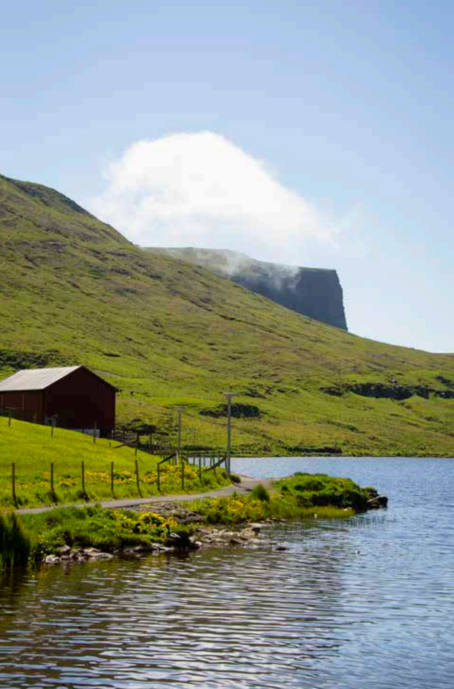
Mynd: Mette Randem