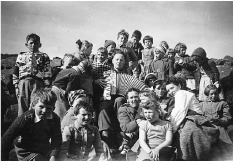
Sunnudagsskúla-útferð í Vági.