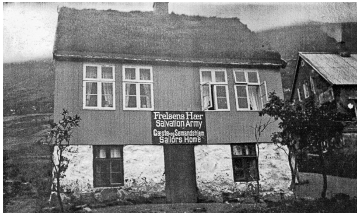
Sjómansheimið í Fuglafirði.