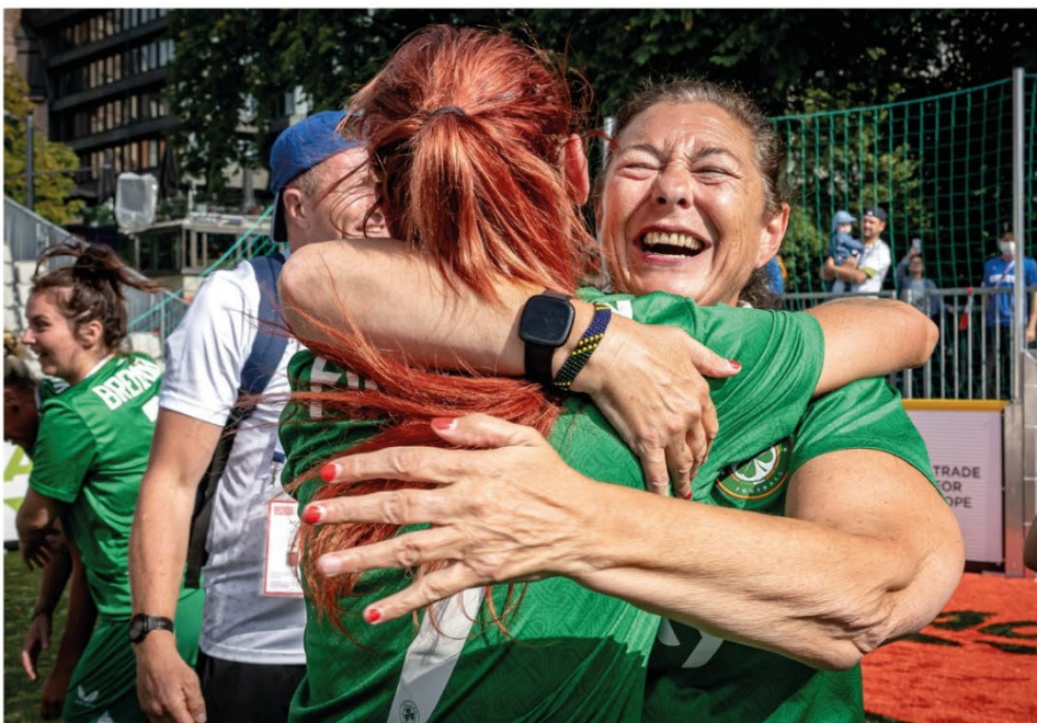
deretter ned på Rådhusplassen. Her danser de sam-