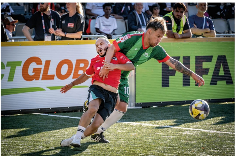
EKTE KAMPER: Spillerne gir alt under kampene, og det går fort i gatefotball. VM gir dem en unik mulighet til positivt innvirkning også utenfor banen.