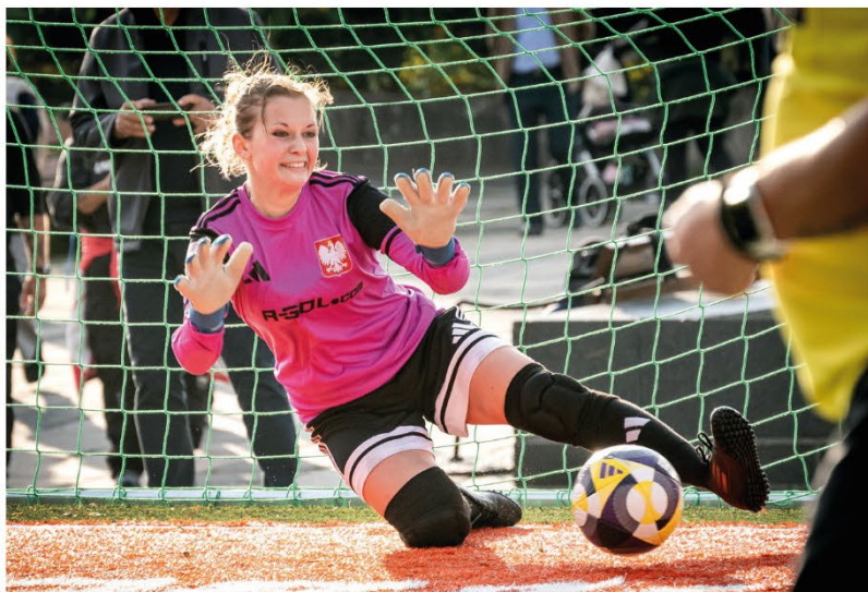
HEIA DAMENE: Da Homeless World Cup ble arrangert i år, var det for 20. gang. Det er fortsatt flest herrelag som deltar, men kvinnene er på frammarsj.

◀ til å høre til. Nettopp derfor er Homeless World Cup så viktig – fordi den kobler idretts glede med samsfunnsending.